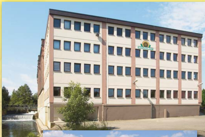
Forvaltning med vannkraftverk

Neudorff bruker fornybar og sikker energi fra egen vannkraftbasert strømforsyning. Vi varmer opp drivhusene i forsøksgartneriet med biogass og forsyner overrislingsanlegget med regnvann. Miljøvern og bærekraftig utvikling er våre hjertesaker, uansett om arenaen er egen hage eller en tropisk regnskog under fjernere himmelstrøk.