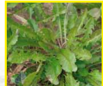
Vor der Anwendung