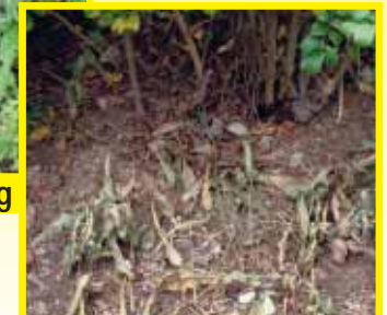
Nach der Anwendung