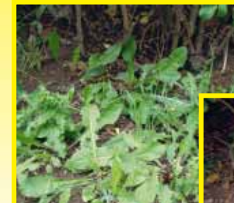
Vor der Anwendung

Finalsan Unkrautfrei enthält einen natürlichen und gleichzeitig effektiven Wirkstoff, der in langer Forschungsarbeit entwickelt wurde. Der Vorteil von Finalsan Unkrautfrei: es wirkt sofort . Schon nach einem Tag ist die Wirkung deutlich sichtbar. Die Blätter der behandelten Pflanzen werden braun und sterben ab. Finalsan Unkrautfrei bekämpft alle wichtigen Unkrautarten im Garten. Bei hartnäckigen Wurzelunkräutern wie Giersch und Ackerschachtelhalms kann es zum Wiederaustrieb kommen, sodass die Behandlung wiederholt werden muss.