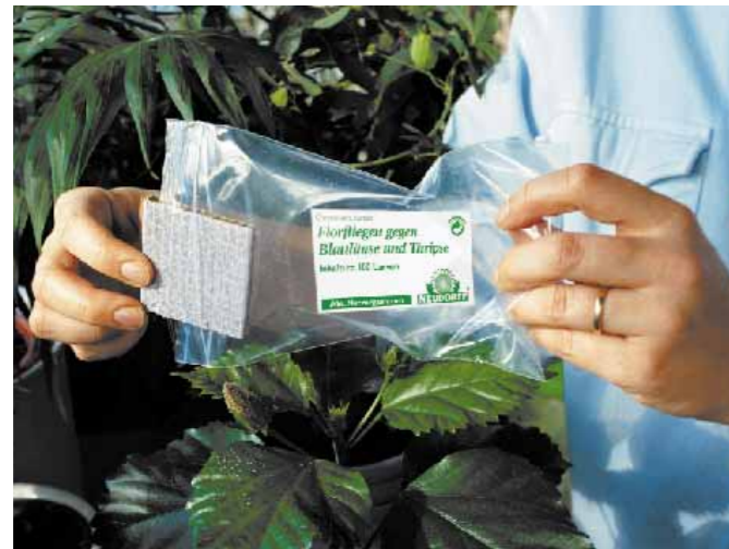
Die nützlichen Helfer können über ein Bestell-Set im Fachhandel bezogen werden